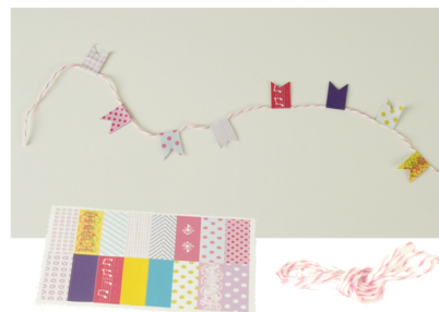
7. Assemblez votre guirlande en collant chaque petit drapeau à cheval sur la ficelle. Coincez-la dans la fente prévue au sommet du présentoir et entourez la autour des pailles.