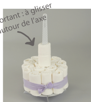
4. Pour le second niveau, glissez une couche roulée autour de l'axe central ; cette étape est très importante et permet de bien consolider l'étage. Complétez autour de couches ou de cadeaux. Maintenez le tout par un ruban.