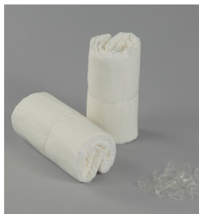
2. Roulez chaque couche du haut vers la base et maintenez-la grâce aux petits élastiques transparents.