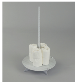
3. Dressez le premier niveau. Commencez par 4 couches autour de l'axe puis complétez autour, et maintenez le tout avec le plus long ruban dès que vous sentez que les couches sur les bords basculent. Une fois consolidé par le ruban, complétez au besoin avec d'autres couches pour bien caler le tout.