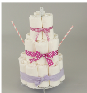
6. Calez chaque paille sur les côtés entre les 2 premiers niveaux