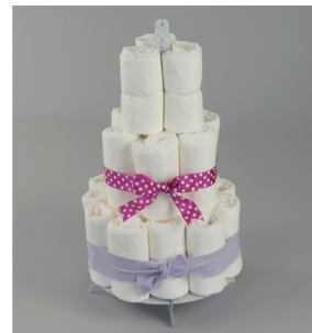
5. Pour le dernier étage, dressez 3 couches autour de l'axe central et les maintenir par un des élastiques transparents, puis un ruban.