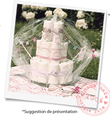
*Suggestion de présentation